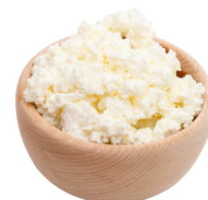
Twaróg półtłusty / ser biały