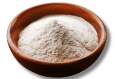
Mąka pszenna, pełnoziarnista