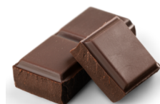
Gorzka czekolada 64% - kostka