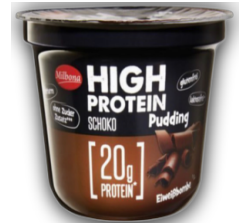
Pilos High Protein Pudding czekoladowy